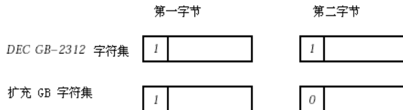
图 2-2 汉字字符的双字节表示法

图 2-2 展示一个汉字在 DEC GB-2312 字符集及扩充 GB 字符集中的表示方法。